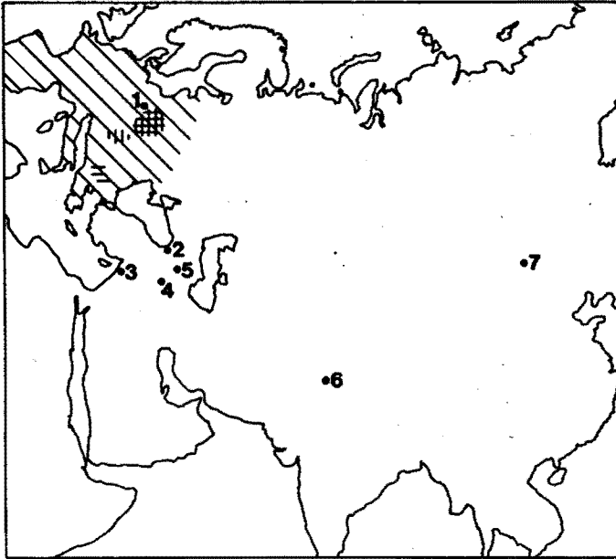
Abb. 2. Verbreitung der paläarktischen Arten von Oligoneuriella ULMER. — Schräge Schraffur: O. rhenana ; senkrechte Schraffur: O. pallida ; waagerechte Schraffur: O. mikulskii ; 1) O. keffermuellerae ; 2) O. tsxhomelidzei ; 3) O. orontensis ; 4) O. baskale ; 5) O. zanga ; 6) O. kashmirensis ; 7) O. mongolica .