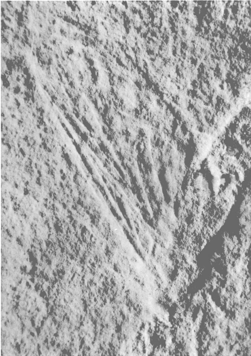
G. DEMOULIN. — Mesephemeridæ d'Europe centrale.