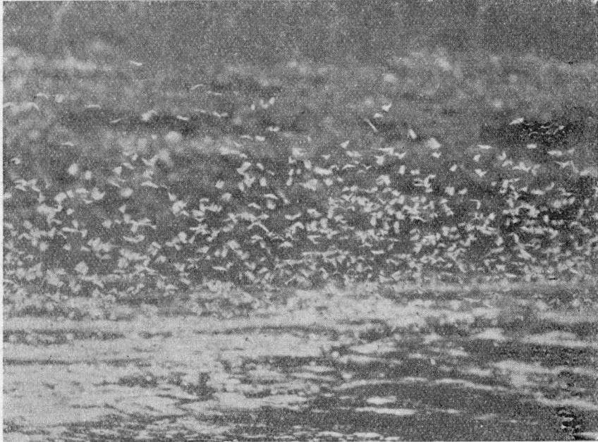
Fig. 2. Vista parcial del enjambre de Asthenopodes observado en diciembre de 1957.

desde el campamento inmediato, sin haberse visto ninguno de ellos. Su desaparición, que tampoco pudo ser observada, ocurrió también con rapidez alrededor de la hora 16:30, habiendo por lo tanto los insectos permanecido continuamente en vuelo por más de ocho horas.